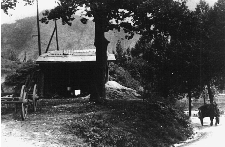
Rademachers (Pliesters) u. Ganten (Hellers) Holzkalkofen unter der Eiche am Dorfeingang – links ein Rungenwagen mit dem das Brennholz angefahren wurde, rechts eine einachsige Pferdekarre, mit der die Kalksteine angeliefert und der gebrannte Kalk abtransportiert wurde.